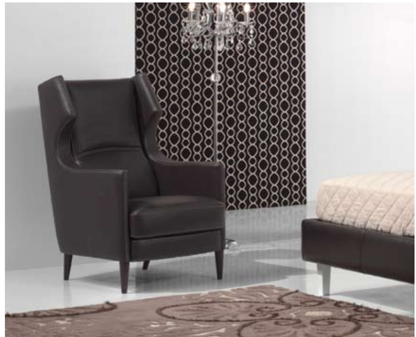
B180 NEW YORK